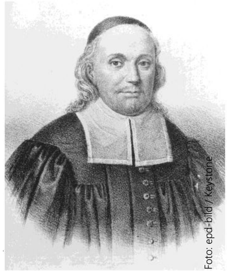
Kupferstich Paul Gerhardt (1607–1676), lutherischer Theologe und Dichter 17. Jahrhundert; aus der Bildersammlung des evangelischen Predigerseminars in der Lutherstadt Wittenberg.

Ab September 1643 lebt der noch immer sogenannte "Student der Theologie" als Hauslehrer in Berlin. Zu der Zeit arbeitet an der Nikolaikirche der Mann als Kantor, der als kirchenmusikalischer Entdecker von Gerhardts Liedern gilt: Johann Crüger (1598–1662). Crügers Melodien verleihen Gerhardts Liedern die ersten Flügel. Durch das