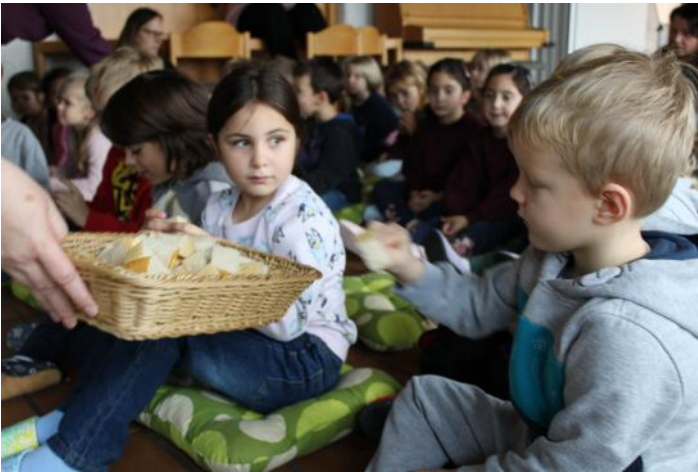
Im Martinsgottesdienst teilen die Kinder Brot miteinander und führen das fort, was sie von Martin von Tours gehört haben.

Am 11. November ging es in der KiTa ganz um den Heiligen Martin. Der Vormittag begann mit einem gemeinsamen Gottesdienst. Dort hörten die Kinder die Geschichte vom Heiligen Sankt Martin und erinnerten sich daran, wie wichtig es ist, miteinander zu teilen. Im Anschluss durften alle Kinder symbolisch Brot teilen, ganz so wie es einst Sankt Martin tat.